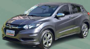
HR-V LX 1.8 FLEX CVT 2018