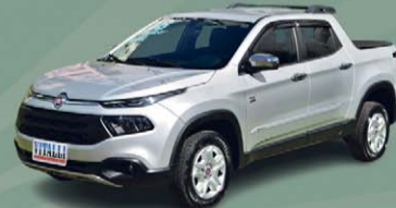
TORO FREEDOM 2.0 4X4 TB DIESEL 2018