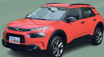
C4 CACTUS FEEL 1.6 FLEX AUT. 2022