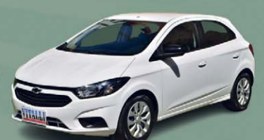
ONIX JOY BLACK EDITION 1.0 FLEX 2021