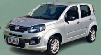
UNO ATTRACTIVE 1.0 FIRE FLEX 2021