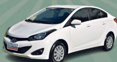
HB20S COMFORT PLUS 1.6 FLEX 2015