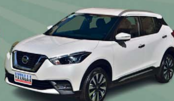
KICKS SL 1.6 FLEX CVT 2020