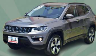
COMPASS LONGITUDE 2.0 4X4 TB DIESEL AUT. 2018