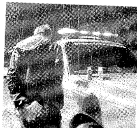
Adolescente portava dois quilos de pasta base de cocaína