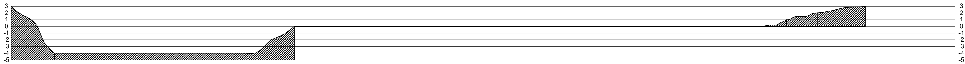
Gráfico de corte e aterro ESCALA: 1:125