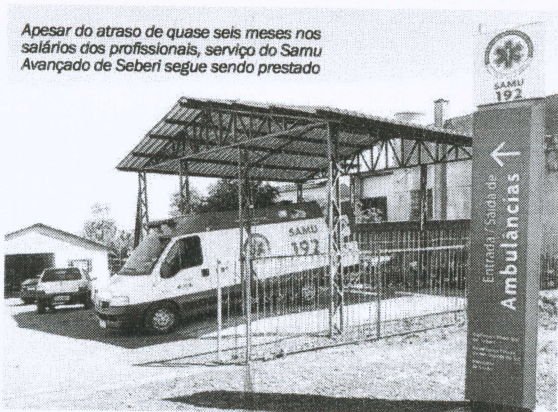
Samu Avançado de Seberí presta o serviço de transporte de pacientes em estado grave para hospitais referência.

Apesar do atraso de quase seis meses nos salários dos profissionais, serviço do Samu Avançado de Seberí segue sendo prestado