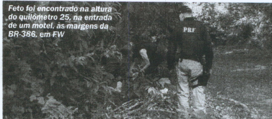
Feto foi encontrado na altura do quilômetro 25, na entrada de um motel, às margens da BR-386, em FW