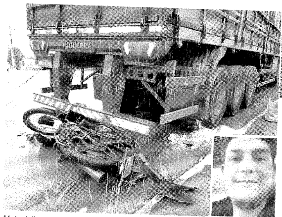
Motociclista teria colidido em uma lixeira e parou atrás de uma carreta

De acordo com a PRF, foi constatado, na nota fiscal de transporte, que havia mais de oito toneladas de excesso de peso. O veículo foi autuado em R$ 2.364,56, além de ser obrigado a realizar o transbordo da carga. O condutor, de 45 anos, foi liberado juntamente com o veículo para retornar para a empresa, onde deverá regularizar a situação.