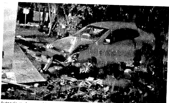
Autor do roubo se acidentou com o táxi durante a tentativa de abordagem da BM

Durante a fuga, uma viatura da BM tentou uma abordagem, mas o motorista não parou e acabou colidindo em uma árvore de uma residência nas proximidades do bairro Bela Vista. Após o acidente, o criminoso fugiu para um matagal e não foi mais localizado.