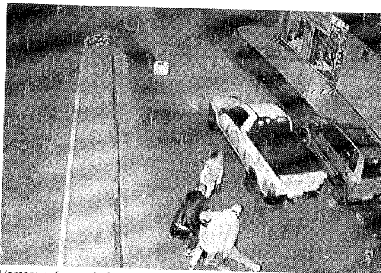
Homem esfaqueado foi atingido na madrugada de sábado, 18, na avenida Flores da Cunha, no bairro Boca da Picada, em Seberí