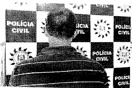
Preso foi encaminhado ao Presídio Estadual de Frederico Westphalen

A partir do ocorrido, uma investigação foi instaurada e o homem, que já era suspeito de estar envolvido nos fatos, foi flagrado por policiais civis na posse de grande quantidade de