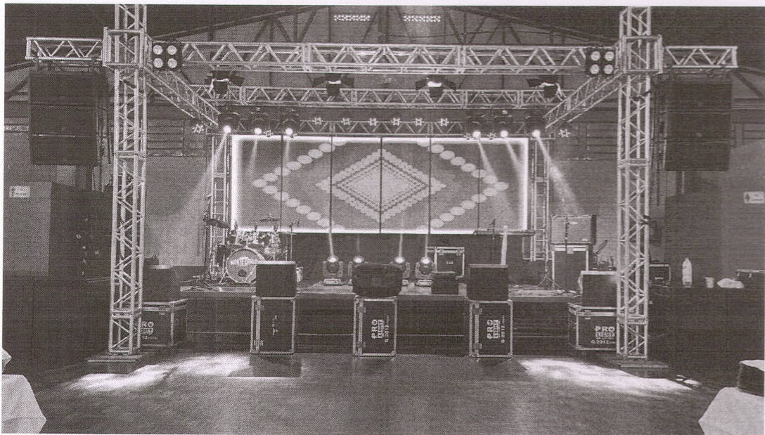
Fonte: Estrutura de som, iluminação e painel de led.