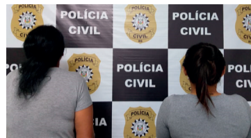
Ação da Polícia Civil ocorreu na manhã de segunda-feira, 24

As duas foram presas preventivamente, após apresentação da autoridade policial. Na mesma oportunidade, durante cumprimento de mandado de busca e