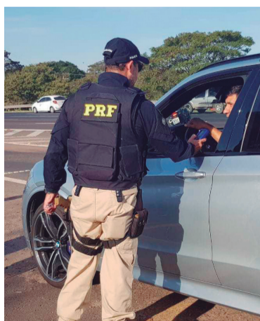
Equipamento possui funções passiva e ativa

No modo passivo, o aparelho dispensa o uso dos bocais descartáveis e demanda menos tempo para conclusão da abordagem, o que diminui os gastos públicos, reduz o lixo plástico e permite que mais motoristas possam ser fisca-