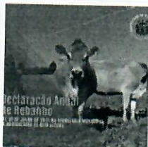
ALTO ALEGRE – Declaração Anual