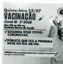
ALTO ALEGRE – Nesta quinta-feira

Publicado em Publicações Legais por jeacontece . Marque Link Permanente .