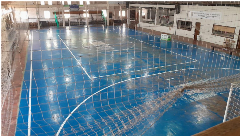
FOTO 01- TONALIDADE PINTURA QUADRA- Quadra Esportiva do Salão Paroquial