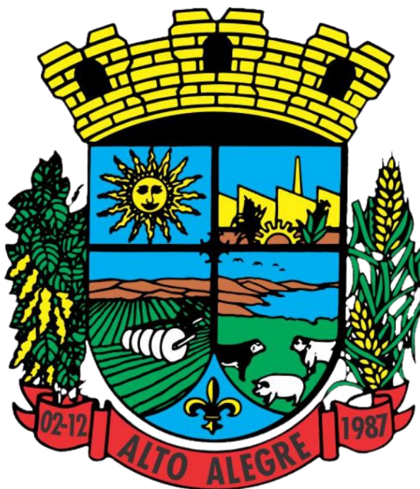
FOTO 02- LAYOUT BRASÃO MUNICIPAL