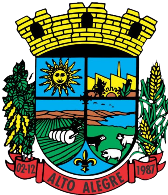
FOTO 02- LAYOUT BRASÃO MUNICIPAL