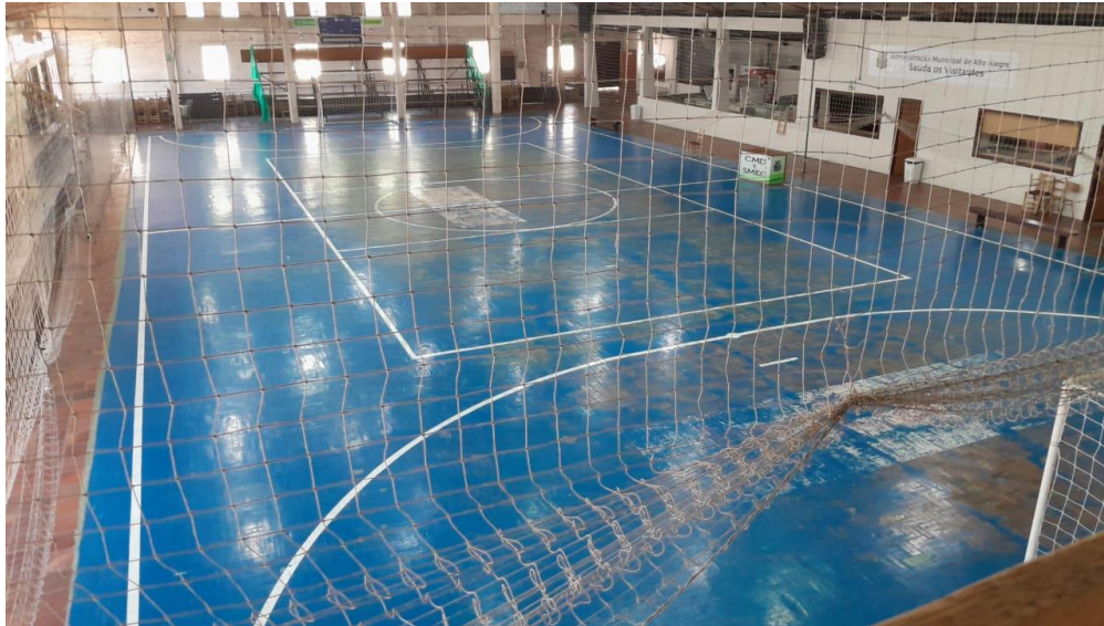
FOTO 01- TONALIDADE PINTURA QUADRA