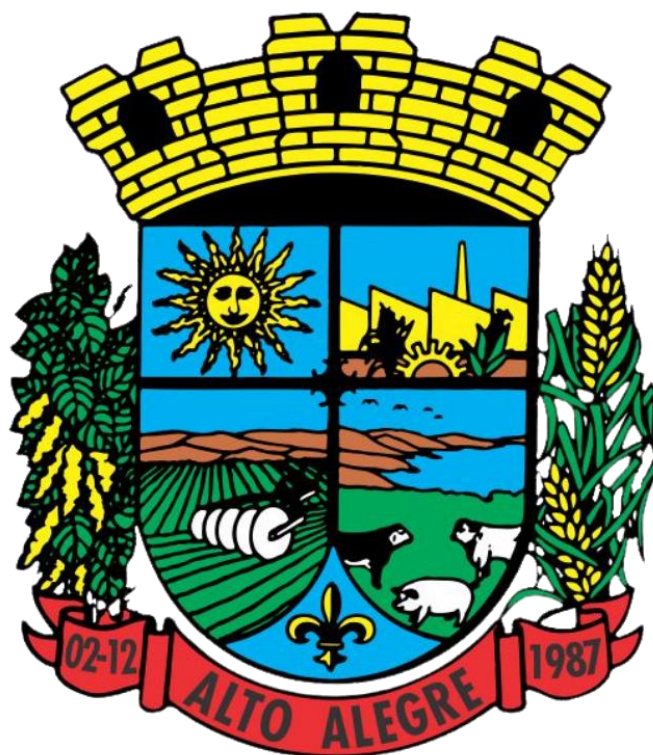
FOTO 02- LAYOUT BRASÃO MUNICIPAL