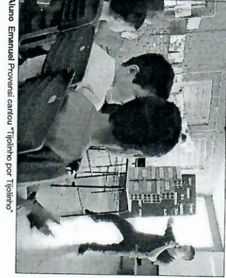
Foto para o trabalho e respeito às diferenças