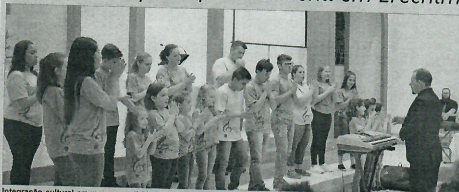
Integração cultural em mais uma atividade dos jovens

No sábado, 29 de setembro, o Coral Municipal Infanto-Juvenil participou do 5º Festival de Coros, em Erechim, evento promovido pela Associação Da Capo Coral Erechim. Participaram também do evento os seguintes grupos: Associação Coral Chapecó; Associação Da Capo Coral Erechim; Coral