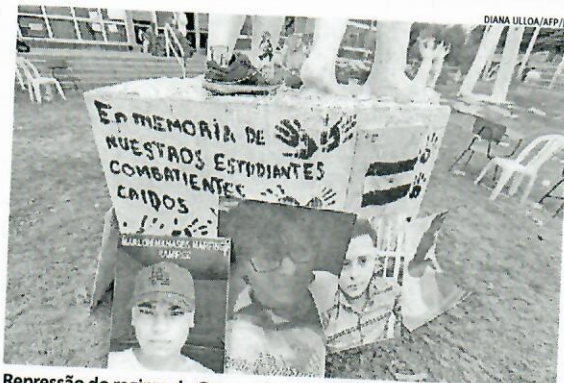
Repressão do regime de Ortega já matou mais de 300 pessoas

Ortega - um dos líderes da Revolução Sandinista, que nos anos 1970 derrubou a dinastia Somoza - tomou posse oficialmente em janeiro para seu 5º mandato. Depois de ser eleito presidente em 1984, voltou ao cargo em 2007 pelas urnas e se manteve no poder ininterruptamente.