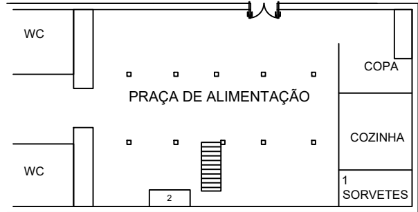
01 Food Truck