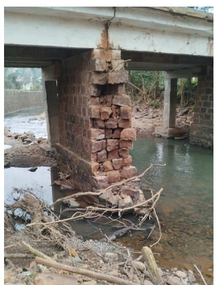
Pilar Ponte S/ Rio Azul a Recuperar