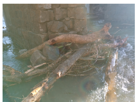
Pilar Ponte S/ Rio Azul a Recuperar

Área a pavimentar - Rua Das Rosas e Rua Das Flores