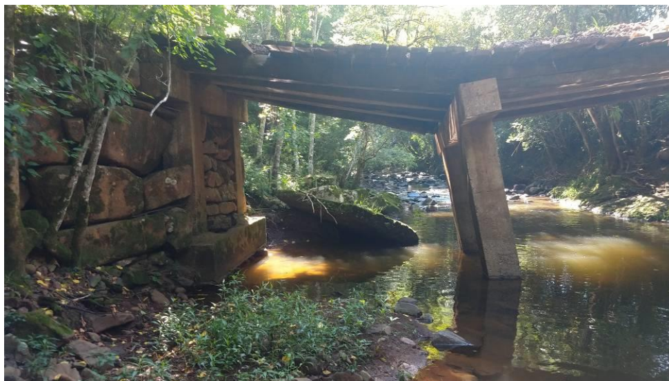
Foto 3 - Situação Atual - Estrutura

A estrutura existente deverá ser totalmente demolida sendo os resíduos destinados conforme orientação da Prefeitura municipal.