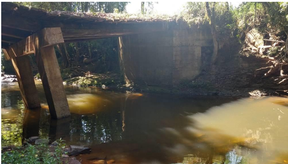
Foto 2 - Situação Atual - Estrutura