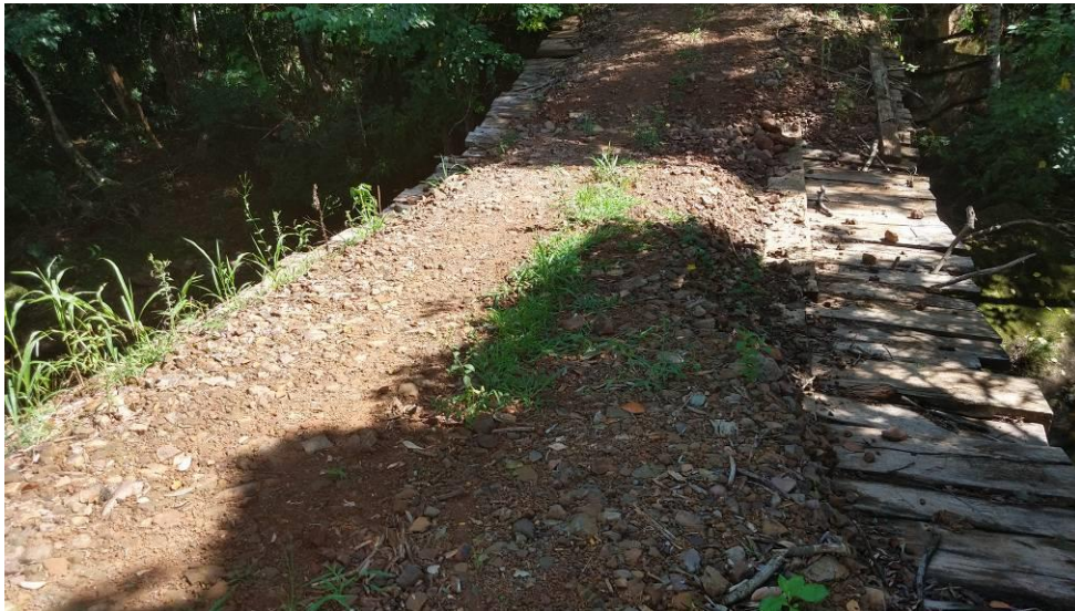
Foto 1 - Situação atual - Tabuleiro