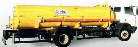
DAOL Cami Vácuo Compressor

Distribuidor de adubo orgânico líquido com bomba vácuo compressor de palhetas