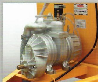
Bomba vácuo compressor de palhetas Baixo custo de manutenção.