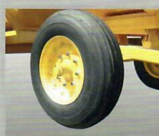
1ERS Aro 20"