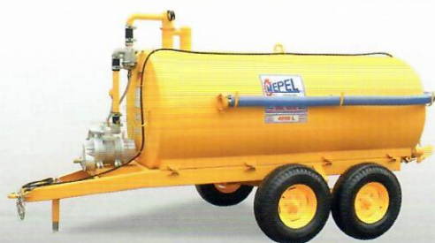
DAOL Vácuo Compressor 4000 TANDEM