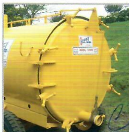
Tampa traseira de inspeção com abertura total.