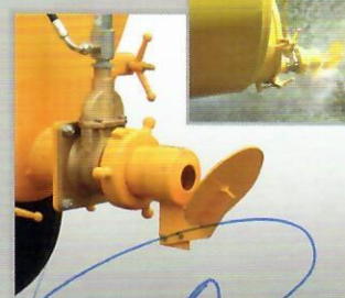
Bico leque aspersor Possibilita a distribuição do adubo orgânico numa faixa de até 15 m.