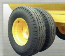
1ERD Aro 16"