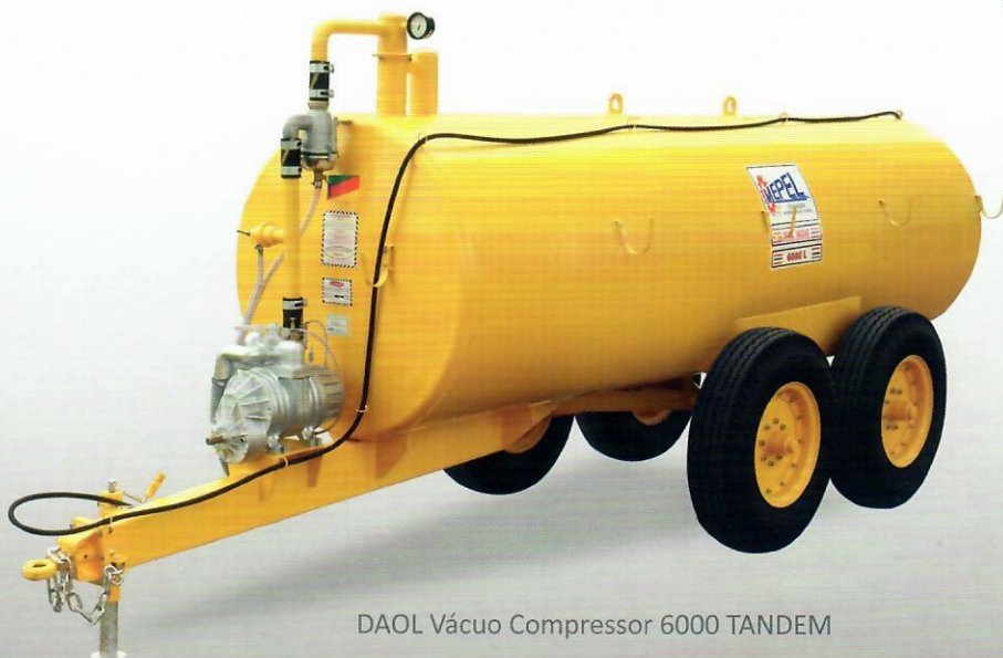
DAOL Vácuo Compressor 6000 TANDEM