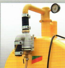
Sifão Retém líquidos e sólidos que passam pela câmara de vácuo impedindo a