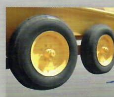
TANDEM Aro 20"