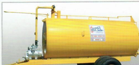
Abertura manual do registro traseiro