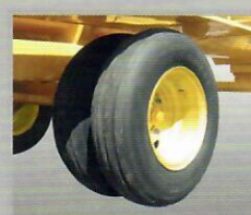
1ERD Aro 20"