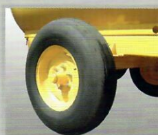
1ERS Aro 16"

Acesse www.mepel.com.br e conheça a linha completa de produtos.