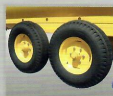
TANDEM Aro 16"