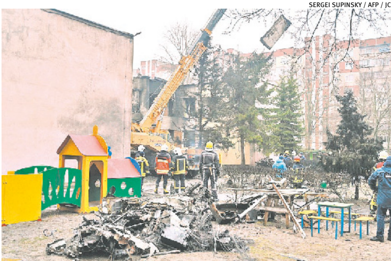
Aeronave caiu perto de escola infantil, deixando 15 crianças feridas

“Tragédia em Brovary (leste de Kiev). O número de vítimas aumentou. Às 10h30min (5h30min no horário de Brasília), 18 mortos, incluindo três crianças”, disse o governador regional Oleksii Kuleba, no Telegram.