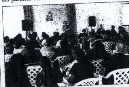
19 de outubro é o Dia Mundial de Combate ao Câncer de Mama

Como parte da programação Outubro Rosa a Associação realizou no dia 13 de outubro o seu Jantar Beneficente com o objetivo de arrecadar fundos para manter a entidade, auxiliar os pacientes cadastrados em suas necessidades e realizar campanhas de conscientização e prevenção.