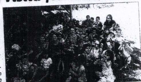
No Mundo Novo, para incentivar relação com o meio ambiente

Na oportunidade os alunos conhecendo o local e a produção das plantas, sala de ordenha e alguns animais, participaram de brincadeiras e piquenique. As crianças têm seu jeito próprio de pensar, estabelecem relações com a realidade que convivem, podem aprender com as trocas sociais e são capazes de compreender e influenciar o ambiente em que vivem, percebe-se como agente integrante e transformador deste ambiente.