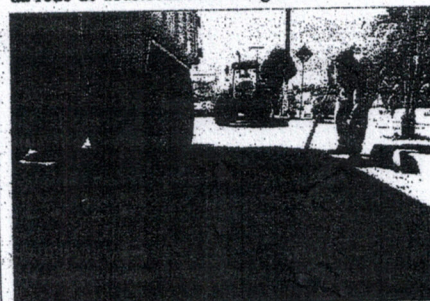
Serviços na Avenida Maurício Cardoso

Na terça-feira, 31, a Secretaria Municipal de Obras realizou serviços de tapa-buracos na Avenida Maurício Cardoso e na Rua Ipiranga. Os reparos foram realizados com cerca de 4 mil quilos de asfalto frio, que a Administração Municipal adquiriu para resolver alguns problemas pontuais de buracos e outros reparos necessários no asfalto, devido a obras da rede de abastecimento de água.