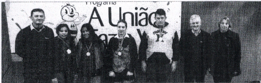
Cantores de Alto Alegre

Evento cultural reuniu cantores de Espumoso, Alto Alegre e Campos Borges