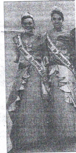
Soberanas do Município

Neste sábado inicia o Torneio Municipal de Futebol Sete, às 14h; às 21h, mais uma classificatória do Rodeio Country; e, às 23h, Baile com animação da Banda Studio. Domingo, 14, às 13h, Baile da Melhor Idade; e Circuito de Gincana com as Comunidades; Touro Mecânico;