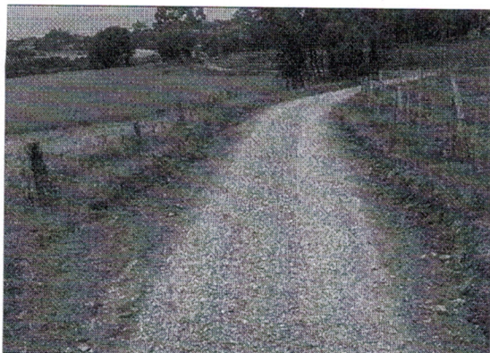
Vias reestruturadas recebem britas

Depois de muitos problemas enfrentados com o excesso de chuvas em outubro e novembro, a Secretaria dos Transportes mantém atividades de revitalização das estradas na região sul do município. Obras de recuperação nas localidades das Campininhas- Campo Comprido e Guanxuma foram realizadas esta semana. De acordo com o prefeito Douglas Fontana, a municipalidade segue com trabalho para deixar as vias interioranas em boas condições para o trânsito. A reestruturação conta com alargamento das estradas, compactação e colocação de britas.