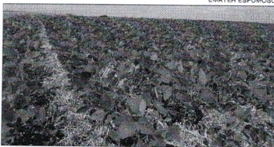
Primeiras plantações estão se desenvolvendo

Com praticamente toda a área prevista de 51.500 hectares plantada no município, agora a expectativa dos sojicultores é em relação ao clima. Muitas lavouras foram plantadas nos últimos dias e há áreas que necessitam de umidade para as sementes germinarem. Por outro lado, as plantações do mês de outubro e início de novembro estão em pleno desenvolvimento. Esta semana choveu de forma irregular, com índices entre 08 e 20 milímetros.