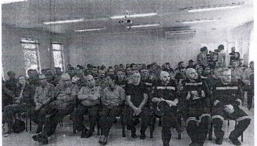
Portaria publicada pelo governo estadual limita a atuação ou até mesmo extingue corporações em cidades