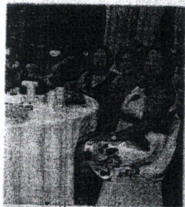
...aram o Dia Internacional da Mulher