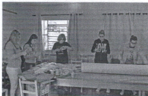
Assistência Social e voluntários confeccionam máscaras para uso da população

A preocupação com a contaminação pelo COVID-19 se torna cada vez maior com o passar das semanas. As medidas de isolamento social iniciaram no mês de março, e além do constante uso de álcool em gel e higienização redobrada, outras formas de proteção se tornam necessárias. Pensando nisso, a Secretaria Municipal de Assistência Social em parceria com a Secretaria Municipal de Saúde e outras entidades municipais, como a Associação do Desenvolvimento e Fortalecimento do Comércio Altoalegrense - ADECA, estão fabricando máscaras caseiras para uso da população, principalmente aqueles que estão em contato com pessoas todos os dias, como comerciantes e servidores públicos.