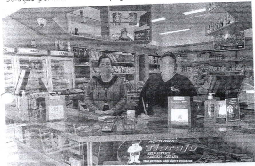
Tiaraju Self-Service, a primeira empresa a aderir ao sistema

Solução permite receber e pagar valores de forma instantânea