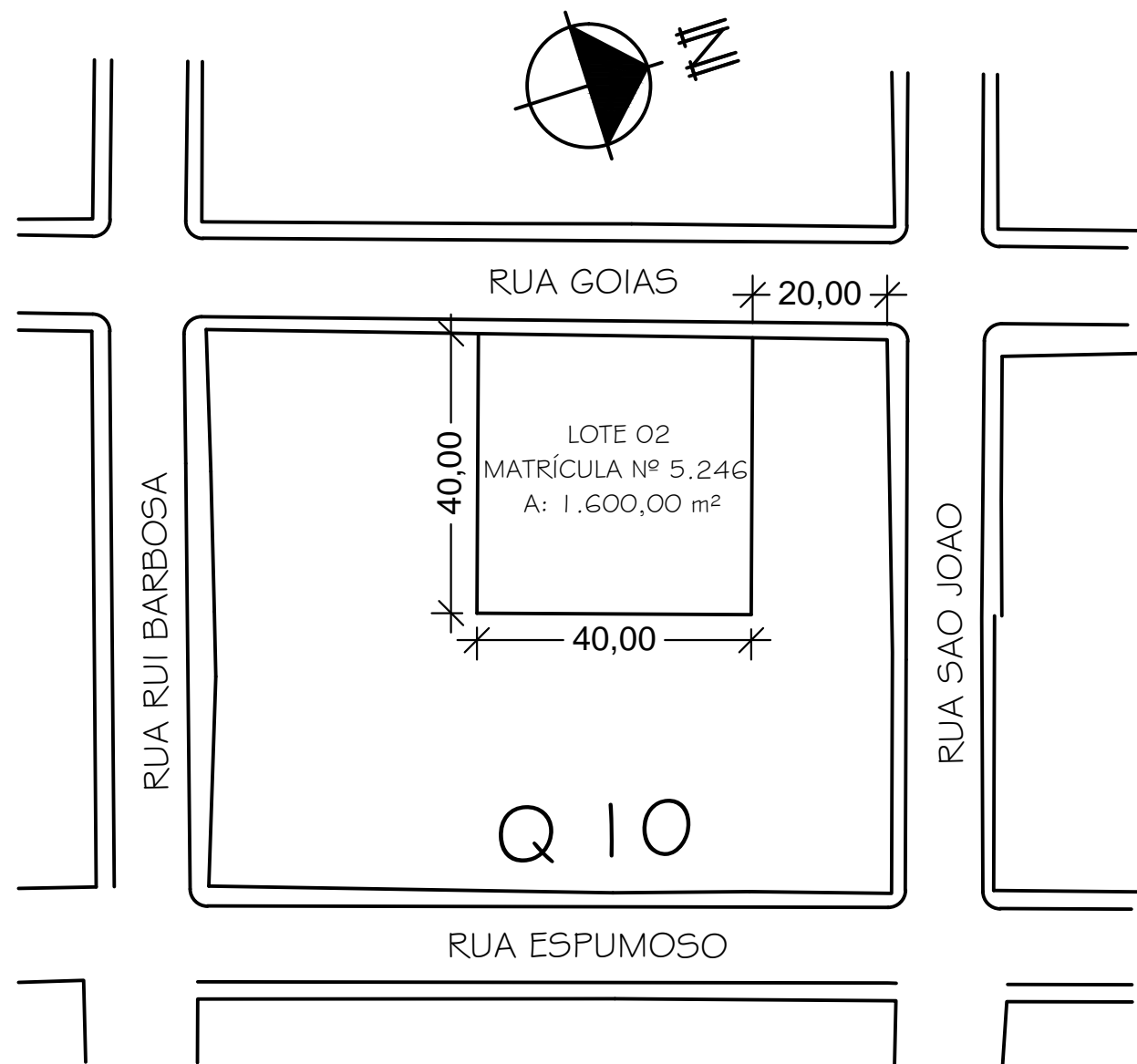
01 PLANTA DE SITUAÇÃO ESCALA: 1/1000