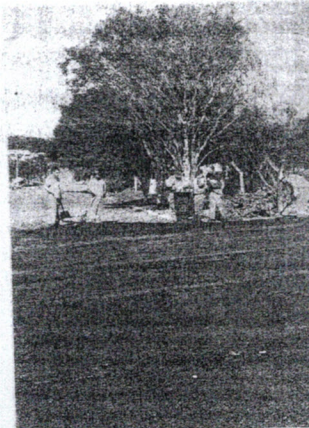
Rua Brasil recebeu a segunda camada

A execução de serviços para obras de capeamento e perfilagem asfáltica estão sendo desenvolvidas em ritmo acelerado pela empresa Construtora Continental. No último final de semana do mês de junho, a Rua Brasil recebeu a segunda camada asfáltica, bem como, houve a continuação dos trabalhos de calçamento na Rua Dionísio Pierezan. Efetivamente as ruas pavimentadas, proporcionarão conforto à população, melhores condições de limpeza, contribuindo para a saúde pública, e proporcionando níveis satisfatórios de segurança, velocidade e economia no transporte de pessoas e mercadorias.