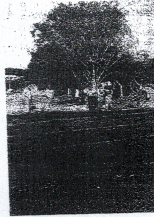
Rua Brasil recebeu a segunda camada

A execução de serviços para obras de capeamento e perfilagem asfáltica estão sendo desenvolvidas em ritmo acelerado pela empresa Construtora Continental. No último final de semana do mês de junho, a Rua Brasil recebeu a segunda camada asfáltica, bem como, houve a continuação dos trabalhos de calçamento na Rua Dionísio Pierezan. Efetivamente as ruas pavimentadas, proporcionarão conforto à população, melhores condições de limpeza, contribuindo para a saúde pública, e proporcionando níveis satisfatórios de segurança, velocidade e economia no transporte de pessoas e mercadorias.