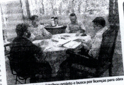
Reunião na prefeitura detalhou projeto e busca por licenças para obra