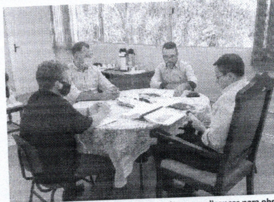
Reunião na prefeitura detalhou projeto e busca por licenças para obra