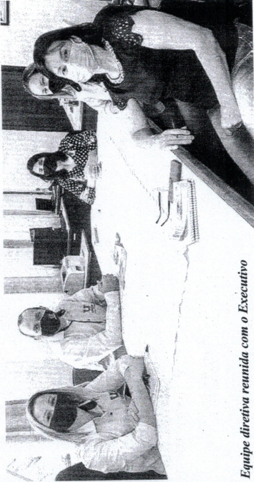
Equipe diretiva reunida com o Executivo