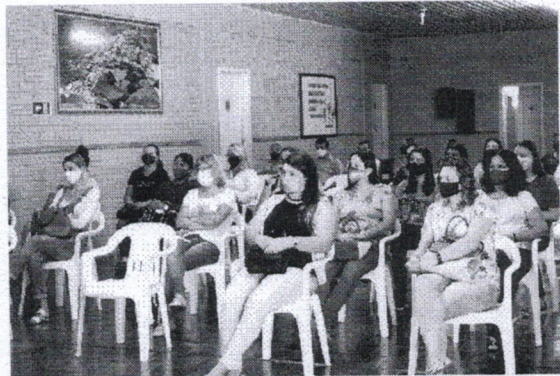
Educadores da rede de ensino de Campos Borges