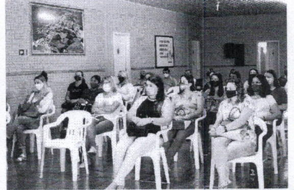
Educadores da rede de ensino de Campos Borges