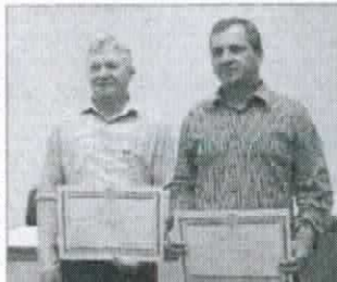
Prefeito e vice foram condenados por compra de votos

A defesa dos réus pediu a extinção da Ação de Investigação, sigilo processual e a decretação da ilicitude das gravações dos áudios e vídeos juntados como provas, o que não foi aceito, por tratar-se, conforme explicou o juiz da Comarca, de campanha elei-