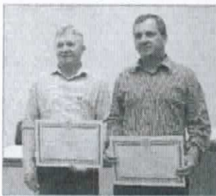
Prefeito e vice foram condenados por compra de votos.

A defesa dos réus pediu a extinção da Ação de Investigação, sigilo processual e a decretação da ilicitude das gravações dos áudios e vídeos juntados como provas, o que não foi aceito, por tratar-se, conforme explicou o juiz da Comarca, de campanha elei-