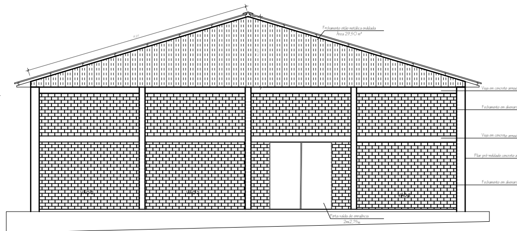
02 FACHADA - OITÃO 1 ESCALA: 1/100