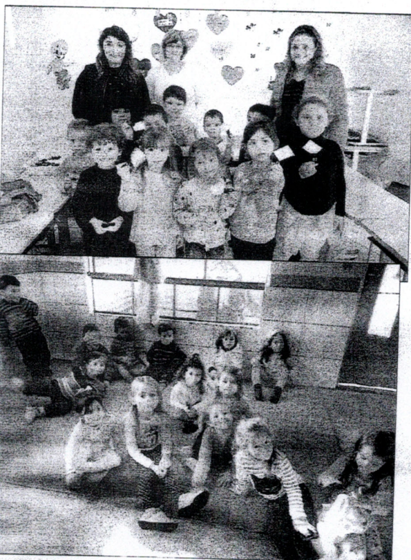
Infantil Toca dos Tocos