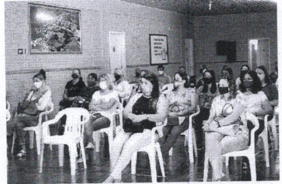
Educadores da rede de ensino de Campos Borges