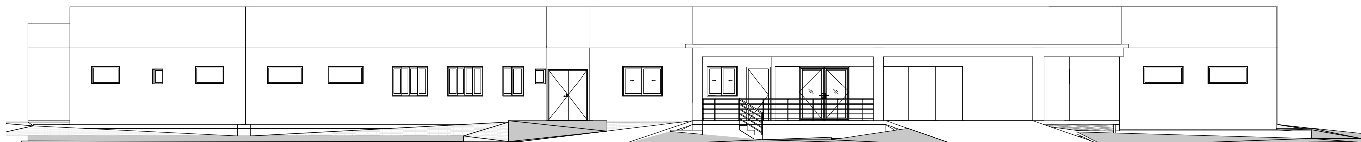
3 Sul 1 : 150