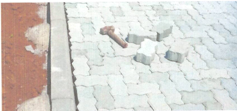
Figura 1 Bloco de Concreto Intertravado