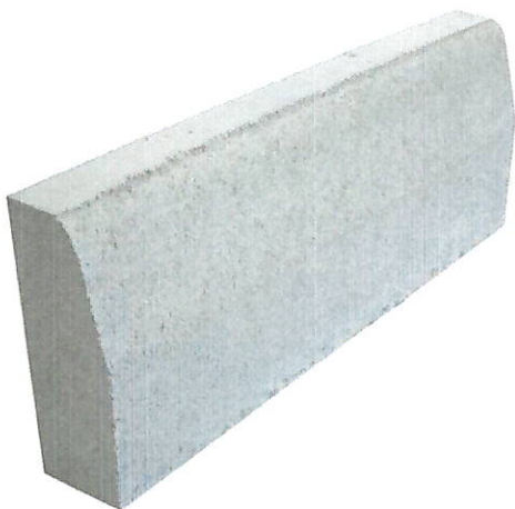
Figura 2 Bloco Meio Fio

Os meio-fios a serem assentados deverão ser inteiros e obrigatoriamente conforme as dimensões acima e não serão aceitos meio-fios danificados, trincados e/ou quebrados.