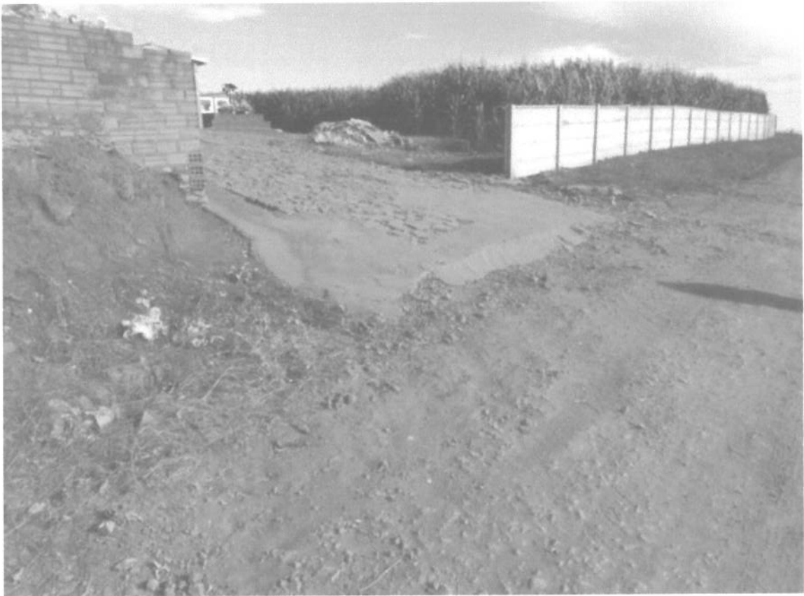
Entrada cemitério - S 28°29'35" – O 52°35'54"