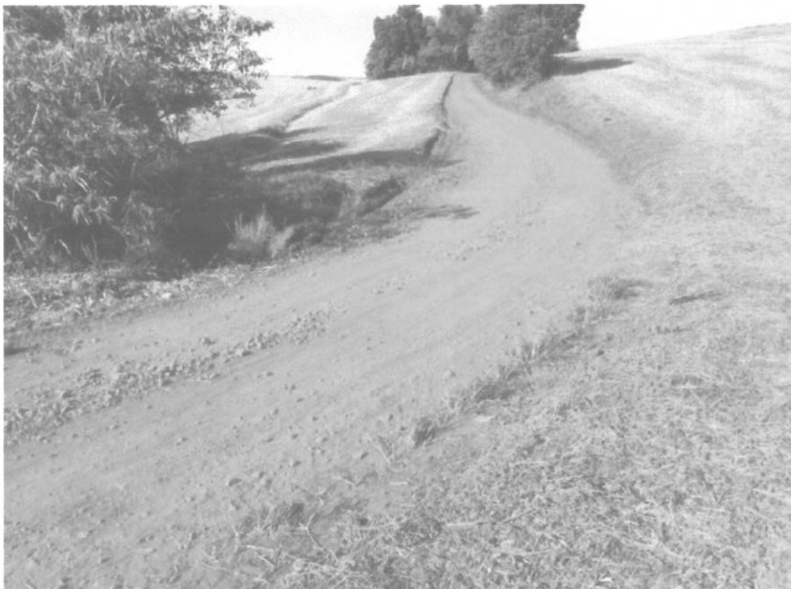
LINHA TIETZE – S 28°29'60" – O 52°36'11"