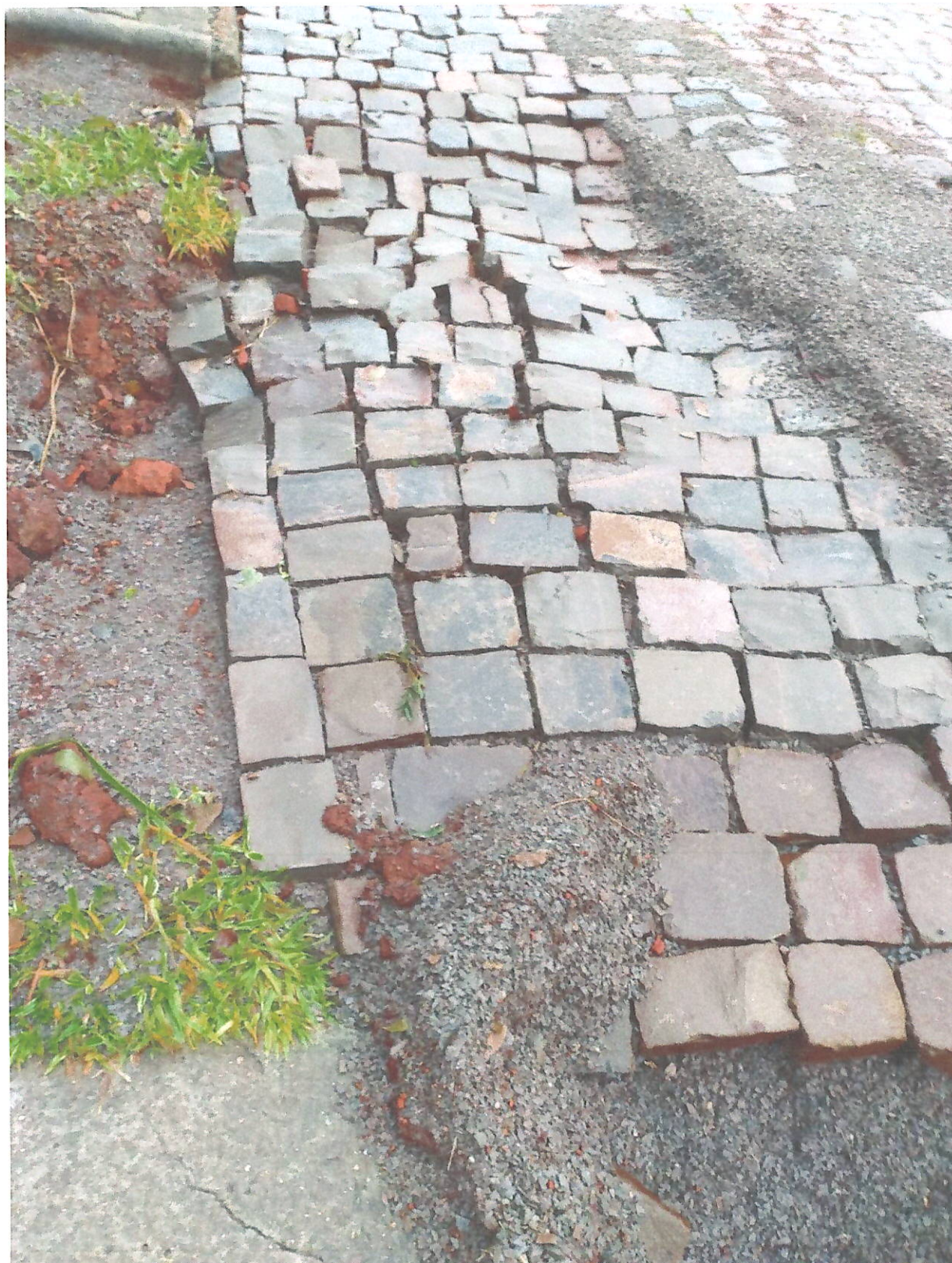
Figura 2 Infiltração no paralelepípedo

Micheli Goedel Téc. em Edif. - CREA/RN 43.027 Eng. de Edif. - CREA/RN 43.027 Município de Ernestina - RS