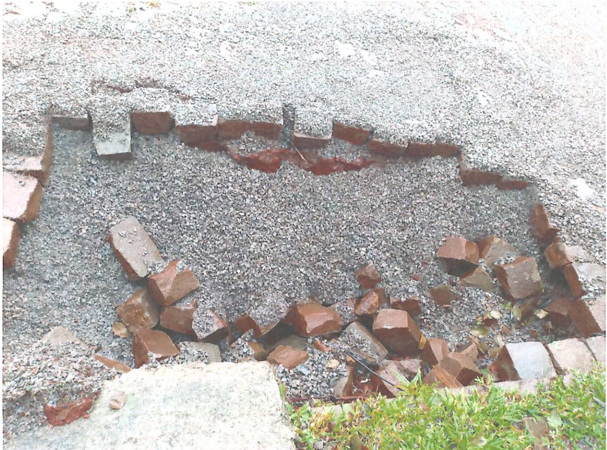
Figura 3 Infiltração no paralelepípedo