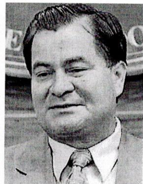
Molina morreu em Brasília, aos 58 anos

No ano seguinte, Molina conseguiu asilo no Brasil sob alegação de perseguição política. Sua fuga para o país, transportado de carro pela fronteira boliviana em Corumbá, no Mato Grosso do Sul, levou à demissão do então ministro brasileiro das Relações