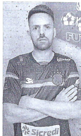
Tcherlo é seleção Gaúcha