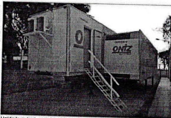
Unidade móvel- estrutura para capacitar percorre o Estado

diversas situações do dia a dia. Sabemos que o setor de alimentos tem perdas, mas precisamos trabalhar para otimizar recursos e levar um produto de cada vez mais qualidade ao cliente".